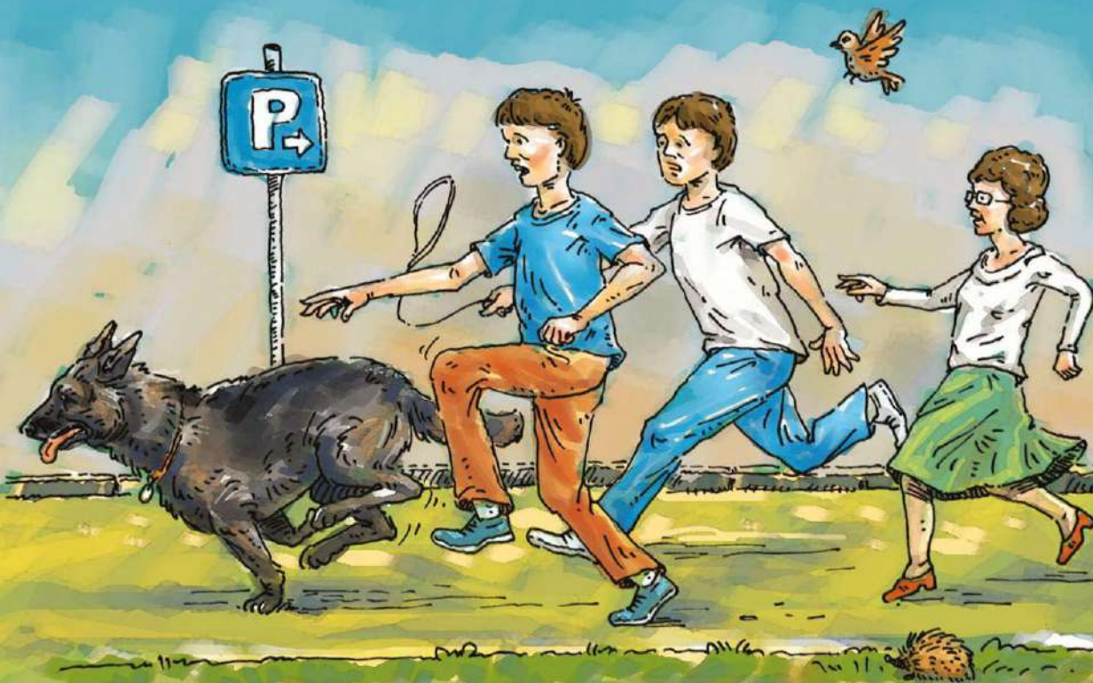
Ilustração de Cristian Polocoser